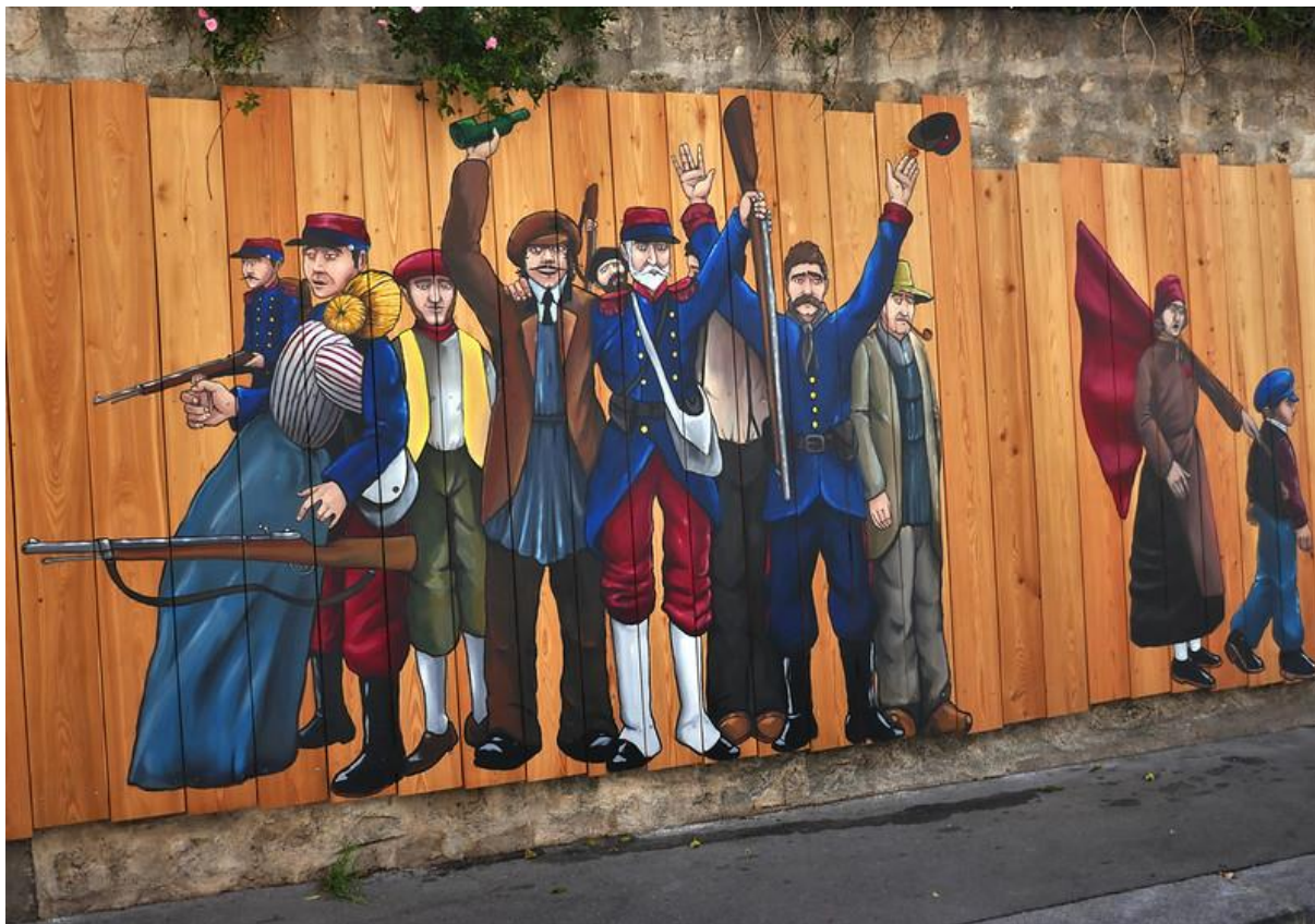
Fresque murale sur le thème de la Commune de Paris, rue de la Ferme Savy (où furent situées les dernières barricades), au bas du parc de Belleville à Paris, réalisée à l'occasion des 150 ans de la Commune par l'artiste Question Mark (projet des Amies et Amis de la Commune)